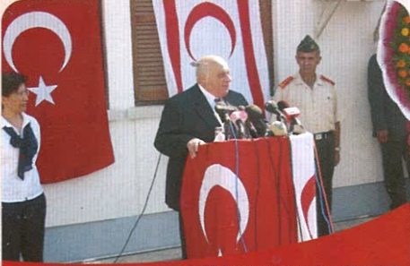
KKTC Cumhurbaşkanı Rauf DENKTAŞ törende yaptığı konuşma sırasında

KROMEL'in Kıbrıs Süt Endüstrisi Kurumu (SÜTEK) adına yaptığı Soğuk