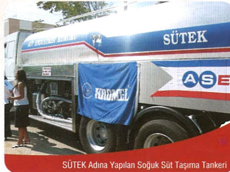
SÜTEK Adına Yapılan Soğuk Süt Taşıma Tankeri

Zincir Projesi çerçevesinde ihale edilen Soğuk Süt Taşıma Tankeri 04 Ekim Pazartesi günü büyük bir törenle teslim edildi. SÜTEK'de düzenlenen devir teslim törenine