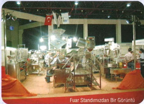
Fuar Standımızdan Bir Görüntü

2 3-26 Eylül tarihleri arasında Antalya / Anfaş Expo Center'da gerçekleştirilen Milk Tech 2004 Uluslar arası Süt ve Süt Ürünleri Endüstrisi Teknolojileri Fuarı'nda siz sevgili dostlarımızla yaklaşık bir ay sonra yine ve yeni bir fuarda tekrar buluşmanın mutluluğunu yaşadık.