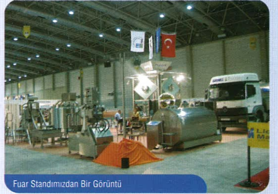
Fuar Standımızdan Bir Görüntü

Gördüğümüz bu yoğun ilginin memnuniyeti ile bu seneki 73. İzmir Enternasyonel Fuarından ayrılmanın mutluluğunu yaşadık. Fuarda bizleri yalnız bırakmayan tüm dostlarımıza teşekkürlerimizi sunuyor, 74. İzmir Enternasyonel Fuarında yeniden buluşmayı ümit ediyoruz.