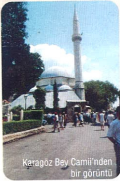
Karagöz Bey Camii'nden bir görüntü