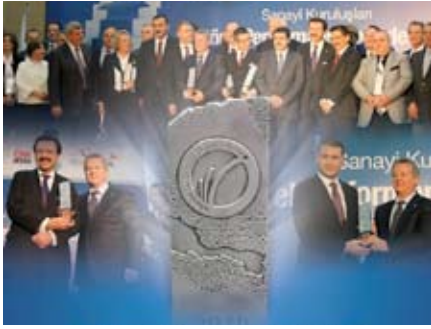
KROMEL, Sektörel Performans Anketi sonucu Makine Sanayi Sektörü KOBİ Kategorisi Ödülü'nü kazandı.

Kocaeli Sanayi Odası' nın CNN Türk ve Avrupa Birliği İş Geliştirme Merkezi (ABİGEM) ve PWC Firması'nın sponsorluğunda Doğu Marmara Bölgesi' ndeki başarılı sanayi kuruluşlarının performanslarını değerlendirmek üzere, Sektörel Performans Anketi sonucunda KROMEL, Makine Sanayi Sektörü KOBİ Kategorisi Ödülü' nü kazandı.