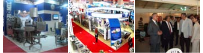
› Agroexpo Eurasia 2011 / Izmir