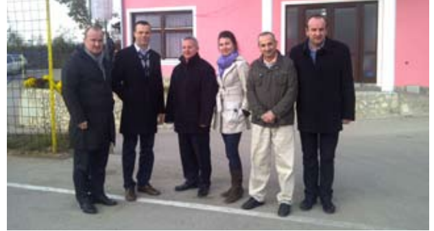
Međunarodni Forum Solidarnosti Emmaus İnsani Yardımlaşma Derneği Üyeleri