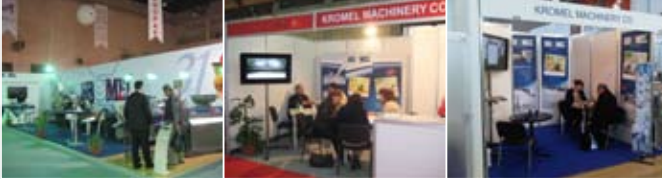
› Machitech 2011 / Suriye