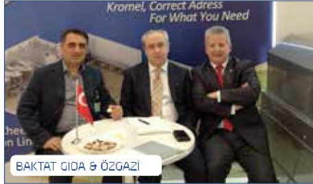
BAKTAT GIDA &amp; ÖZGAZI