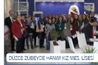
DÜZCE ZÜBEYDE HANIM KIZ MES. LİSESİ