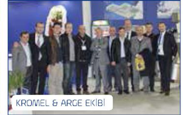
KROMEL & ARGE EKİBİ

Sayfa alanımızın sınırlı olması sebebi ile yer veremediğimiz dostlarımızdan özür dileriz.