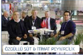
ÖZGÜLLÜ SÜT & İTİMAT PEYİRCİLİK