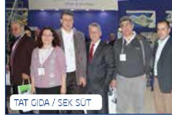
TAT GIDA / SEK SÜT