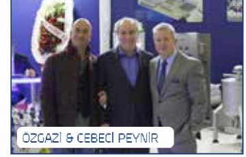
ÖZGAZİ & CEBECİ PEYİR